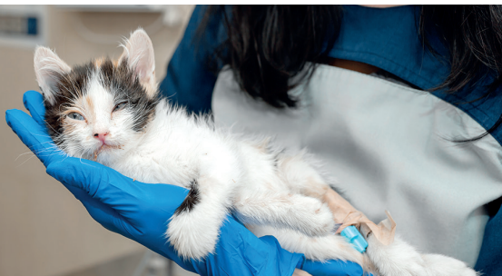
Junge Straßenkatze (Jungtier) in Notfallbehandlung