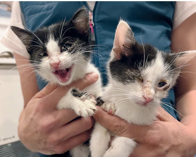
Kitten mit akutem Katzenschnupfen

Streunerkatzen leiden an Hunger, Krankheiten, Parasitenbefall und Verletzungen, sind meist nicht kastriert und vermehren sich dadurch unkontrolliert. Erfahren Sie, wie Sie durch gezielte und präventive Maßnahmen wie Kastation und Kennzeichnung einen bedeutenden Beitrag zum Schutz freilebender Katzen leisten können.